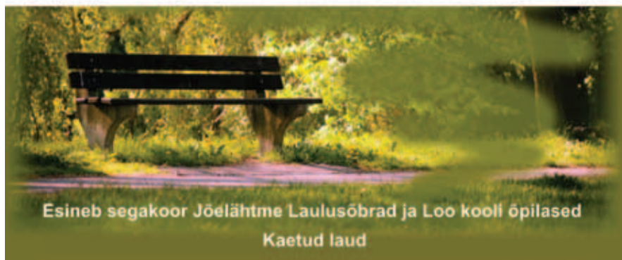
Esineb segakoor Jõelähtme Laulusõbrad ja Loo kooli õpilased Kaetud laud

Esmaspäeval, 2. septembril kell 18.00 Loo kooli esisel platsil AARE VÄRTE nimelise pingi avamine