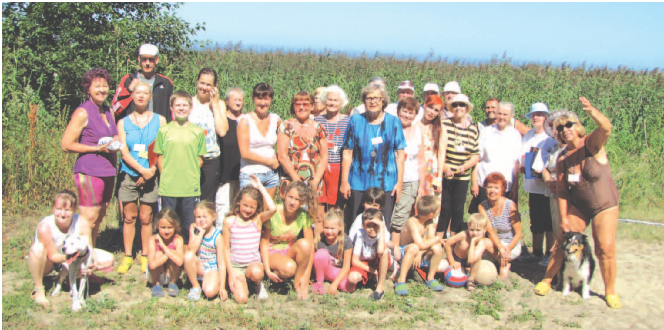
Saviranna küla rahvas tegi möödunud aastal pallimängude jaoks liivasele rannaalale väikese spordiplatsi. Tänavu külaseltsi korraldatud spordipäeval olid kavas täpsusvise, kaugushüpe, köieveedu ja muud põnevad. Jõukatsumine toimus kõikides vanuserühmades, noorim osaleja oli kahe aastane ja väärikaim 83-ne. Lusti ja rõõmu pakkus see päev nii vanadele kui ka noortele, suur tänu korraldajatele ja kohtunikekogule. Pärast mõnetunnist meeleolukat sportimist peeti maha piknik. Parimatele anti diplomid ja riputatud kaela medalid. Hea traditsioon jätkub tuleval aastal.